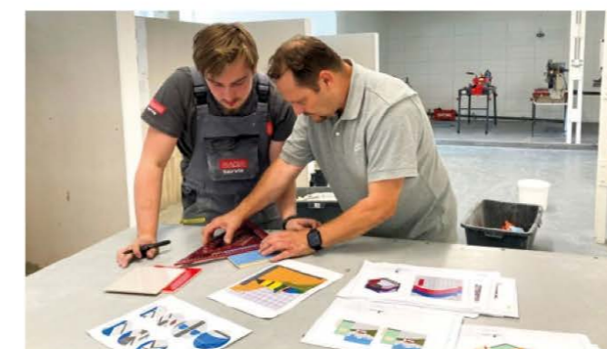
Společnost LASSELSBERGER se stala výhradním dodavatelem českých obkladů RAKO a stavební chemie RAKO SYSTEM na soutěži i pro tréninky soutěžících v oboru obkladač na nadcházející celoevropské soutěži EuroSkills 2023.