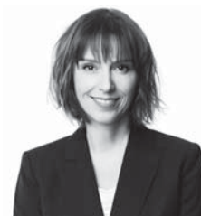
MARTINA DLABAJOVÁ, poslankyně Evropského parlamentu a členka Kontaktní skupiny k očkování proti covidu-19