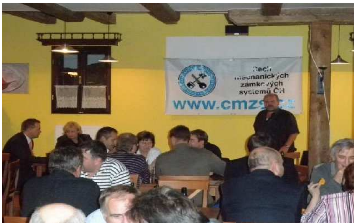
Obrázek 3 Účastníci Společenského večírku