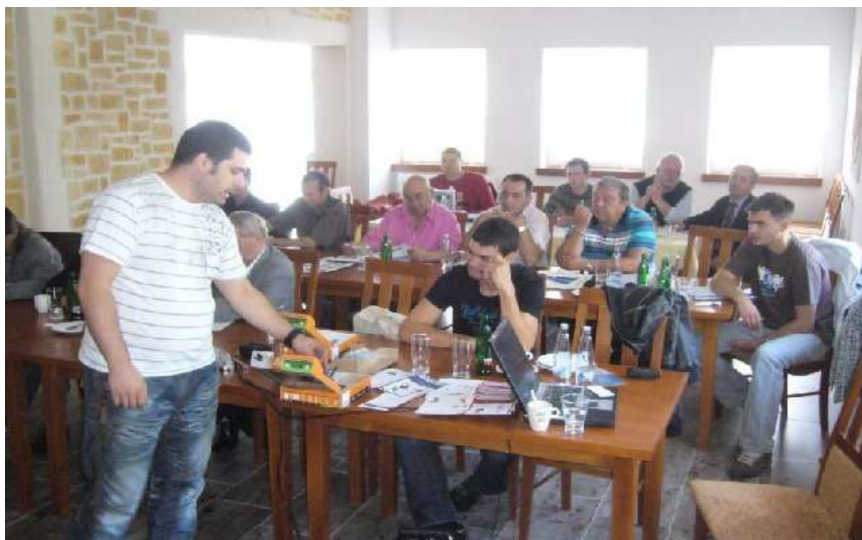
Školení firmy TOKOZ a.s. v Havířově dne 25. 9. 2010