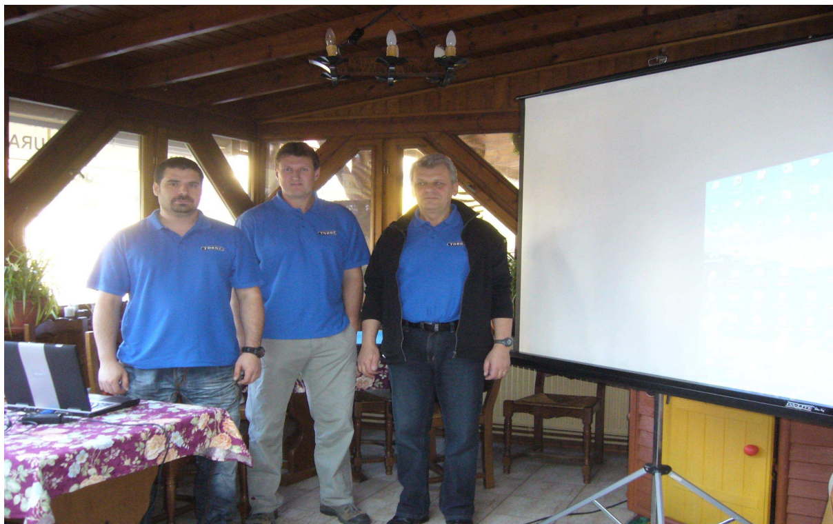
Školení firmy TOKOZ a.s. v Jinočanech u Prahy dne 23.10. 2010