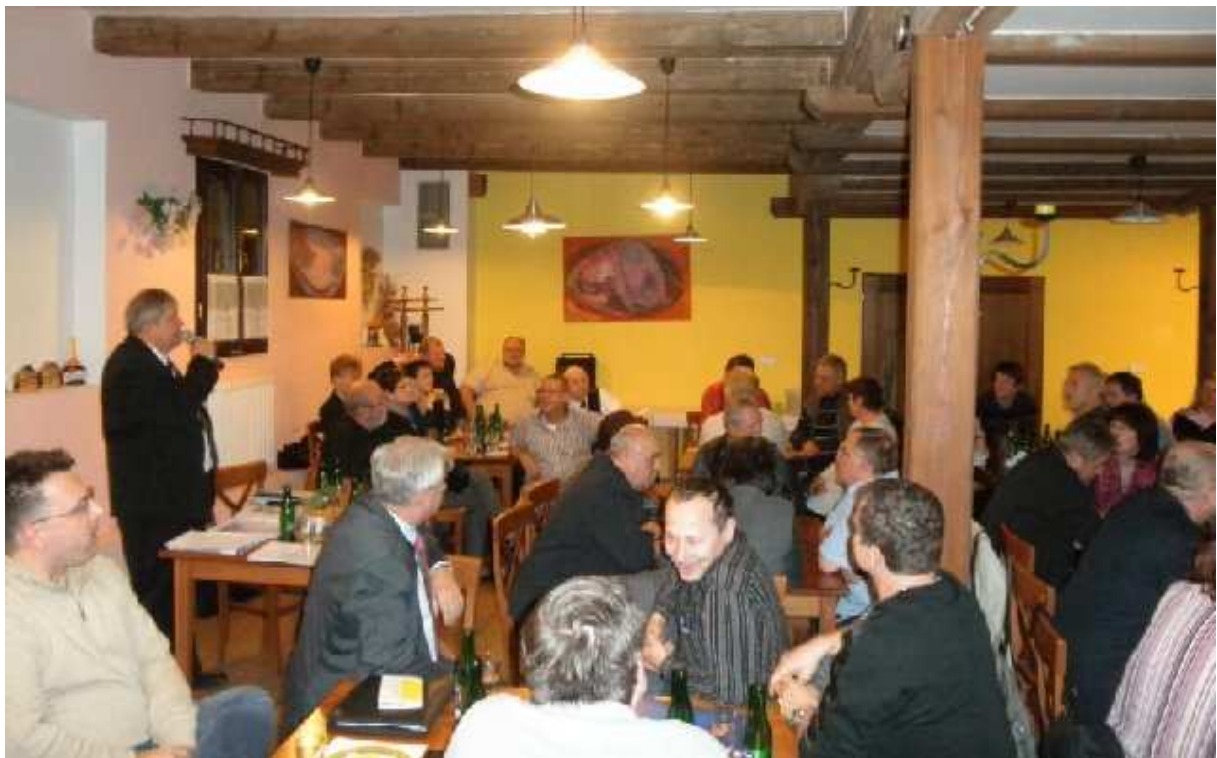
Obrázek 2 Účastníci Společenského večírku