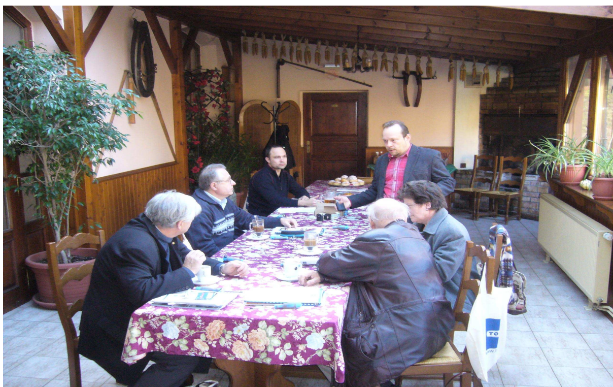
Školení firmy TOKOZ a.s. v Jinočanech u Prahy dne 23.10. 2010