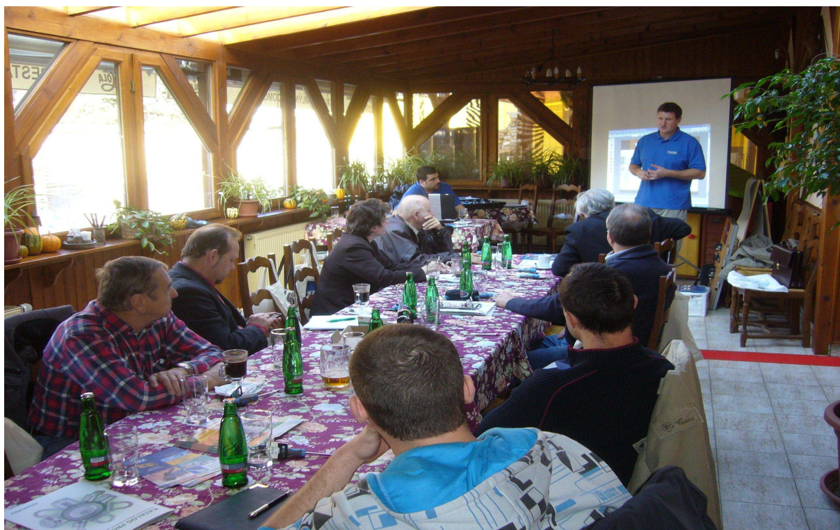
Školení firmy TOKOZ a.s. v Jinočanech u Prahy dne 23.10. 2010