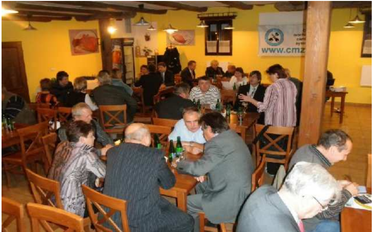
Obrázek 1 Účastníci Společenského večírku