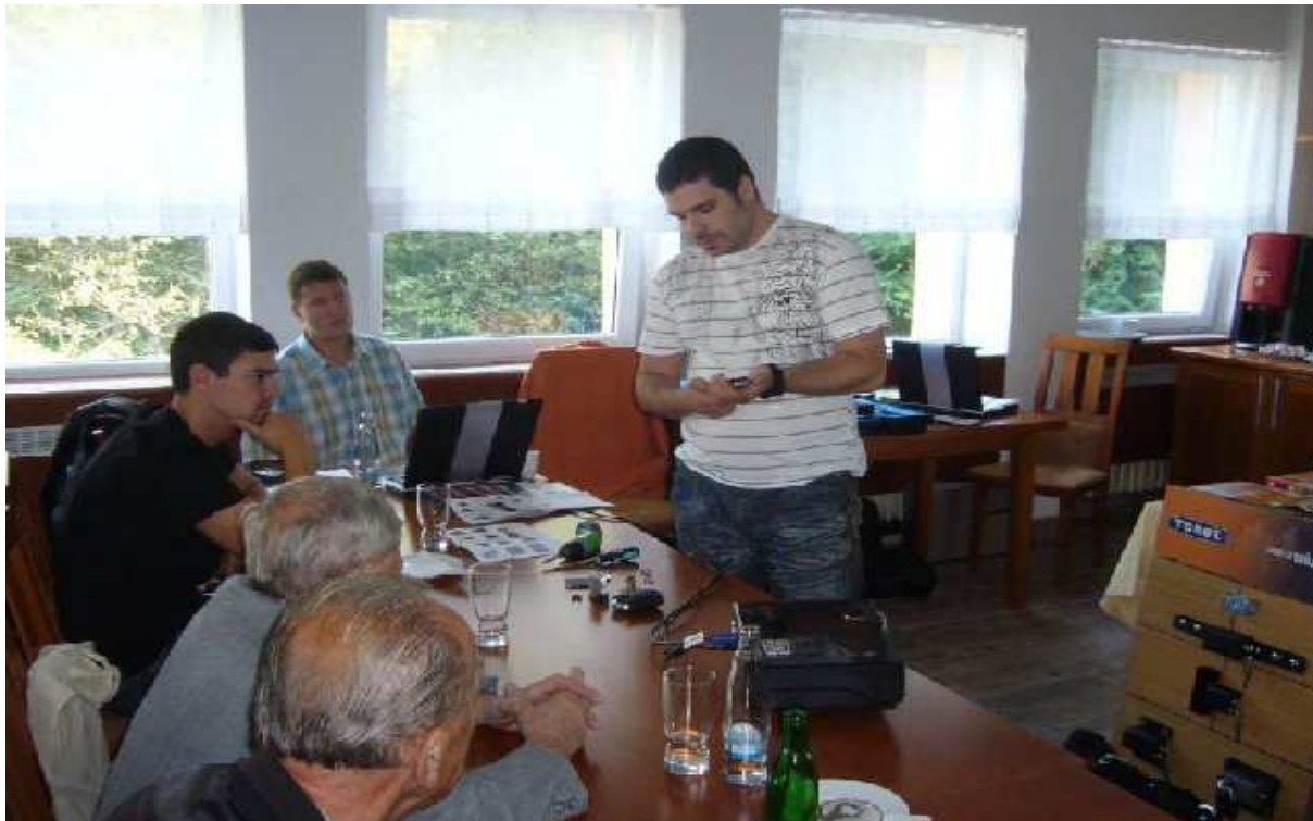
Školení firmy TOKOZ a.s. v Havířově dne 25. 9. 2010