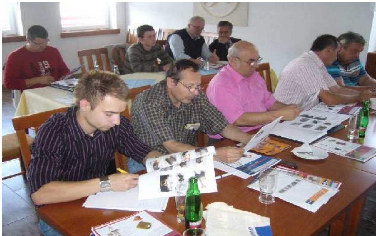
Školení firmy TOKOZ a.s. v Havířově dne 25. 9. 2010