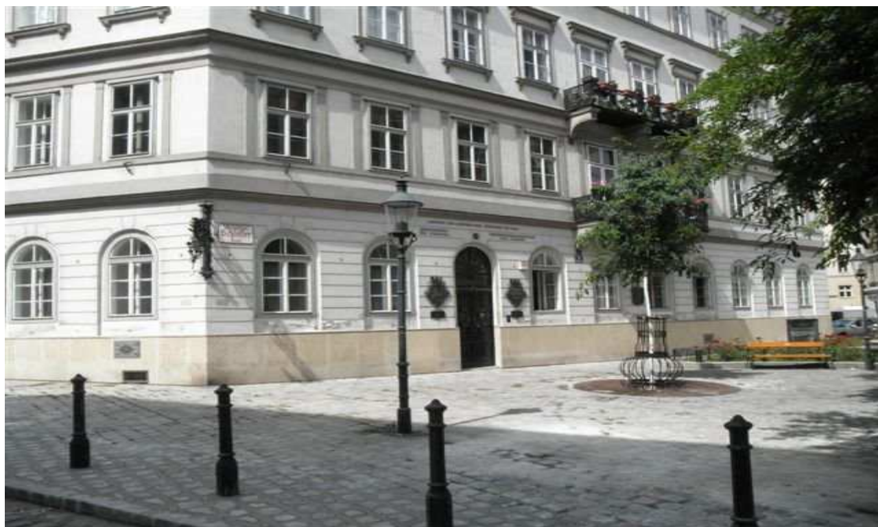
Budova - "Národní cech Vídně"