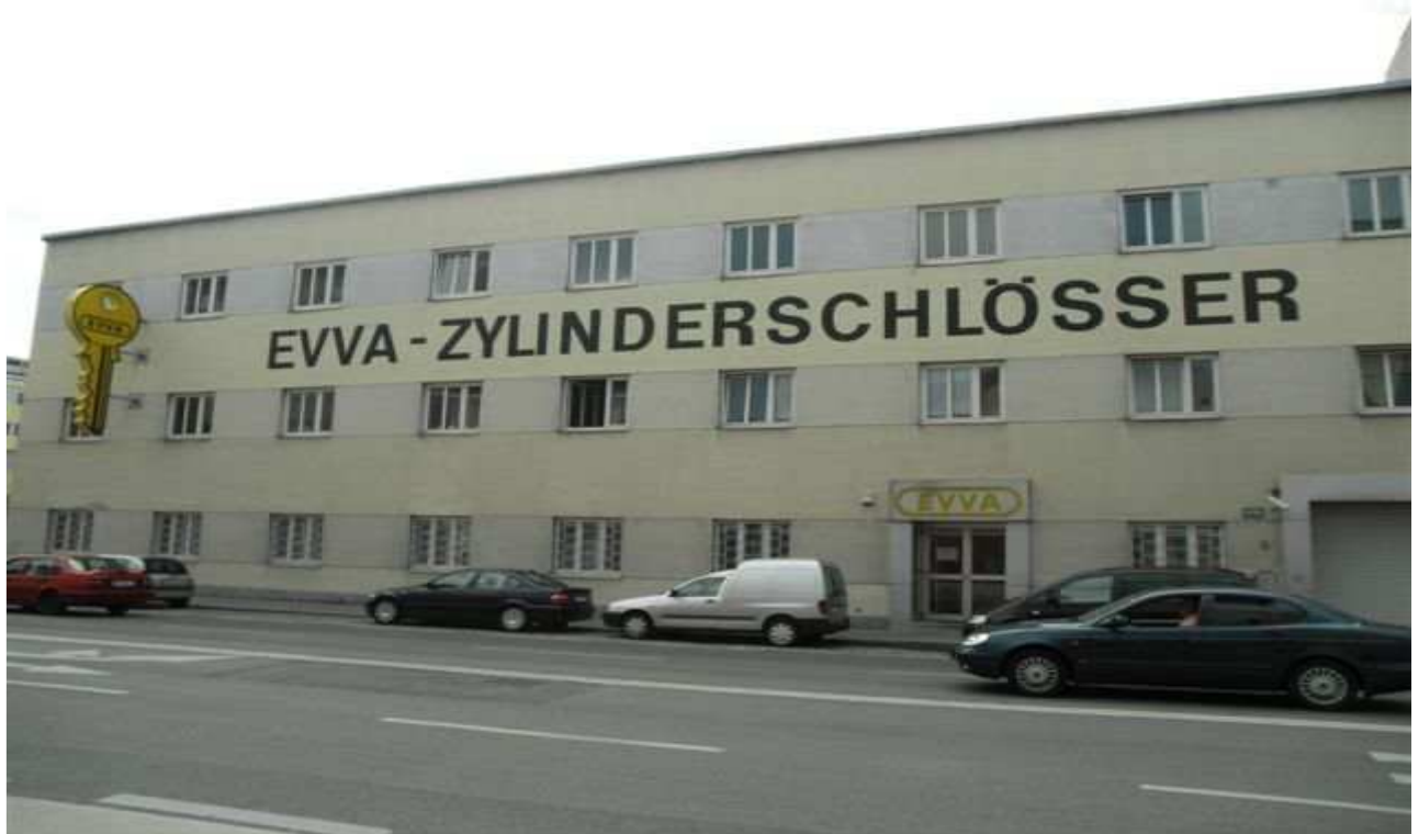
Firma EVVA, GmbH - Wien