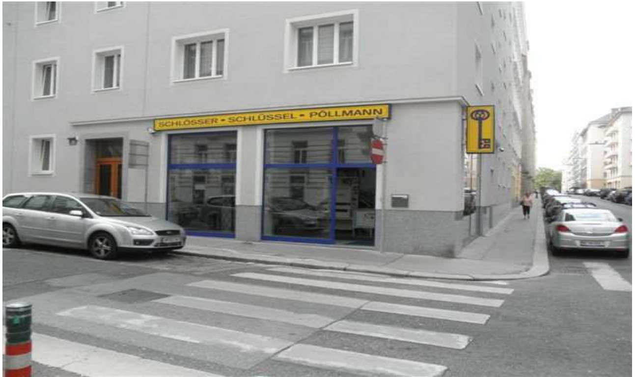
Prodejna firmy Pollmann - Wien