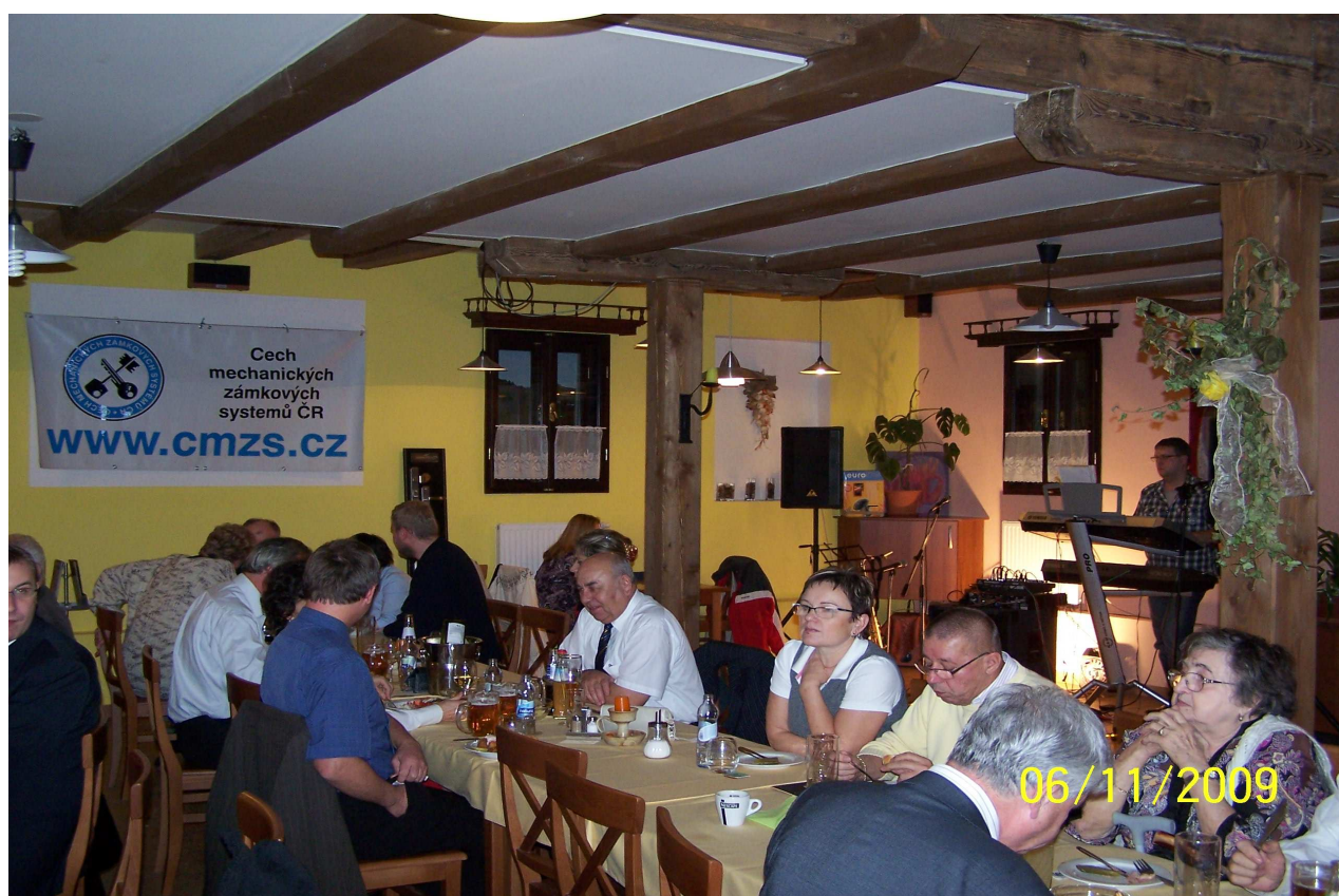
Fotografie ze Společenského večírku ve Vyškově.