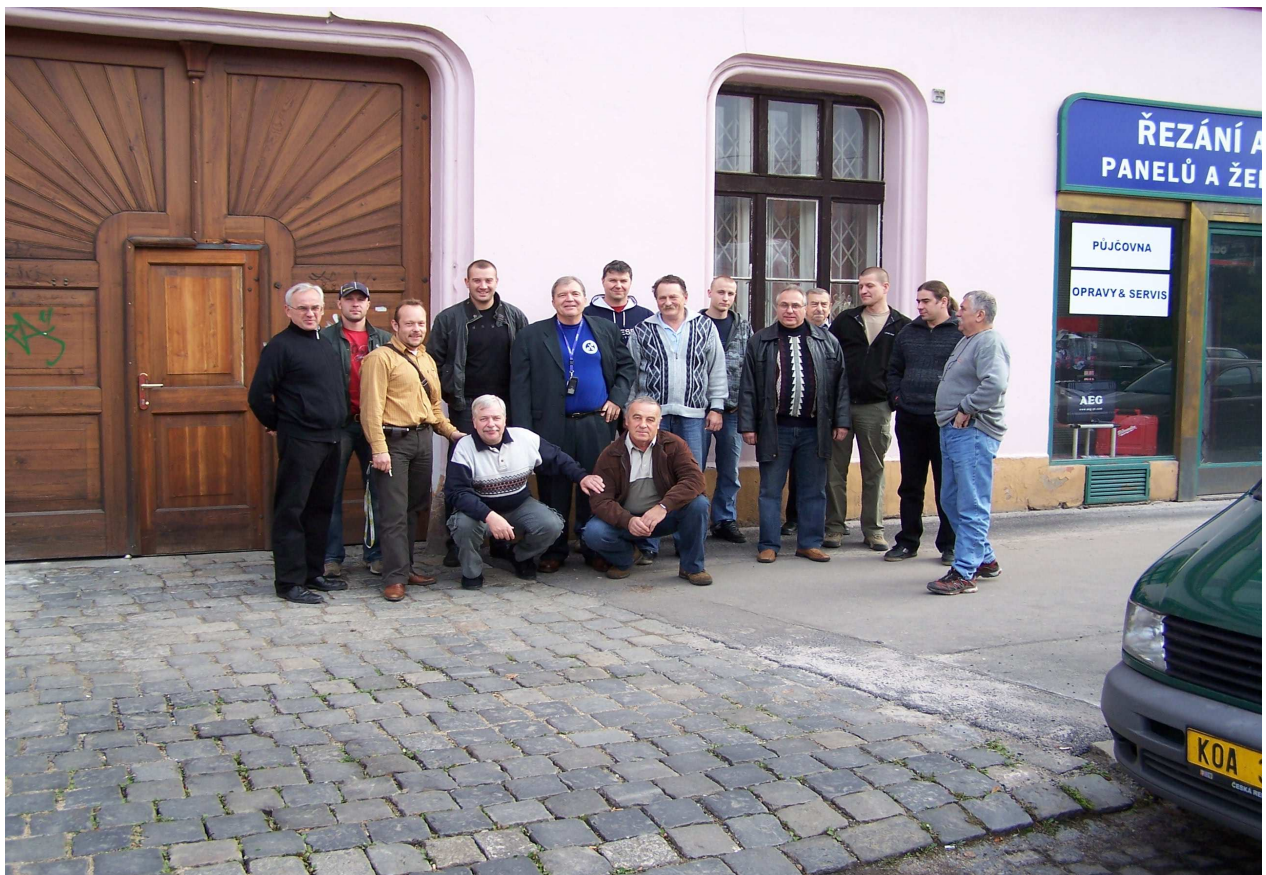
Fotografie ze školení v Praze.